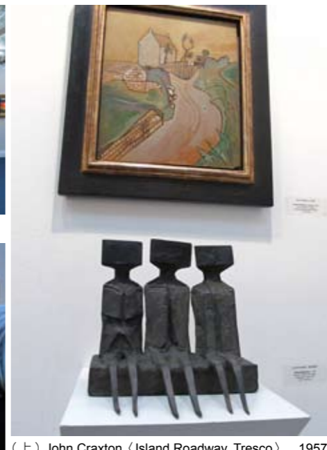
(上) John Craxton《Island Roadway, Tresco》 1957 (下) Lynn Chadwick《Sitting Watchers》 1975