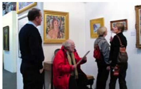
觀眾專注欣賞作品。